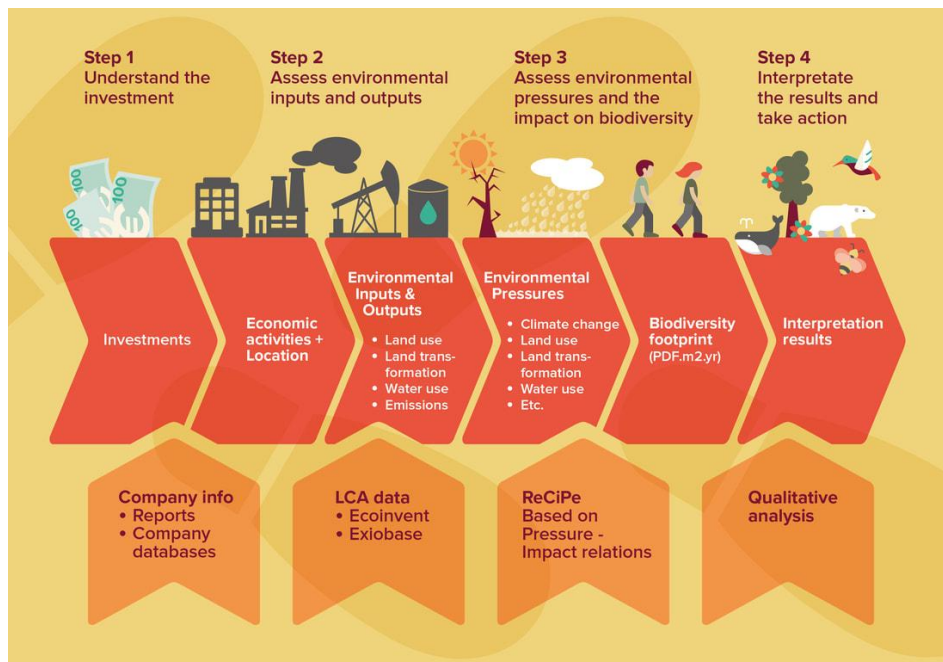
Figur 4. Sammanfattning av PFFI metoden (Broer m.fl., 2021).