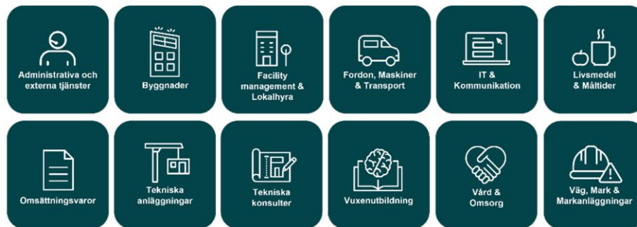
Figur 1. De tolv kategorifamiljerna i Göteborgs Stads gemensamma kategoriträd för inköp.

Syftet med förstudien är att undersöka om en metod kan utvecklas för att kunna mäta hur stadens inköp påverkar biologisk mångfald. Metodiken ska utformas i relation till leverantörsmarknaden och bygga på de insikter som framkommer genom denna förstudies omvärldsbevakning. Nästa steg blir att applicera metoden på olika inköpskategorierna i Göteborgs Stad (Figur 1).